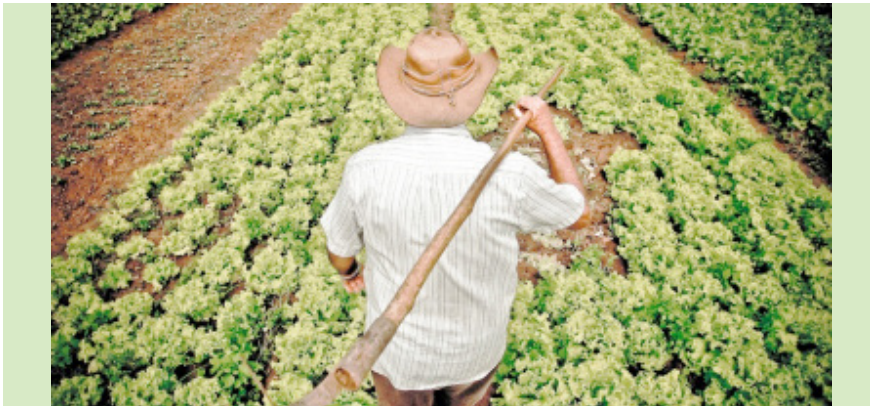
Pequena produção é beneficiada com recursos da Sudam

Implementar ações que visem a organização e a geração de renda de trabalhadores rurais e de mulheres de baixa renda está entre os principais benefícios a serem gerados pela Sudam em 2016. Os projetos fazem parte dos convênios e termos de cooperação firmados pela instituição, em 2015, em parceria com governos estaduais e prefeituras de diversos municípios da Amazônia.