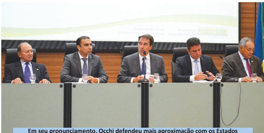
Em seu pronunciamento, Occhi defendeu mais aproximação com os Estados

Os menores estados da Amazônia são os que mais precisam dos investimentos da Sudam. A afirmação é do ministro da integração nacional, Gilberto Occhi. Durante a posse da nova diretoria da instituição, Occhi destacou que a Sudam precisa levar investimentos para os estados menos desenvolvidos da região. Para tanto, o ministro sugeriu que a Sudam seja proativa no sentido de ir aos locais onde o crescimento econômico ainda é tímido. “Peço que nos próximos